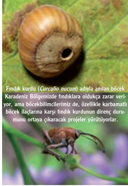
Fındık kurdu ( Curculio nucum ) adıyla anılan böcek Karadeniz Bölgesinde fındıklara oldukça zarar veriyor, ama böcek bilimcilerimiz de, özellikle karbamatlı böcek ilaçlarına karşı fındık kurdunun direnç durumunu ortaya çıkaracak projeler yürütüyorlar.

Metabolik dirençte, dirençli böcekler zehirli maddeleri duyarlı böceklerden daha hızlı etkisiz hale getirmekte ya da zehirli maddeyi hızlıca vücutlarından atabilmekteler. Bu tip direnç en yaygın