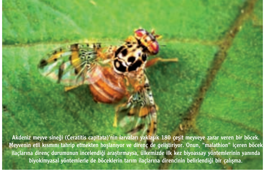
Akdeniz meyve sineği ( Ceratitiss capitata )’nin larvaları yaklaşık 180 çeşit meyveye zarar veren bir böcek. Meyvenin etli kısmını tahrip etmekte hoşlanıyor ve direnç geliştireyor. Onun, “malathion” içeren böcek ilaçlarına direnç durumunun incelendiği araştırmaysa, ülkemizde ilk kez biyoassay yöntemlerinin yanında biyokimyasal yöntemlerle de böceklerin tarım ilaçlarına direncinin belirlendiği bir çalışma.

Ülkemizde, Akdeniz, Ege ve İç Anadolu bölgelerinden toplanan değişik M. persicae popülasyonları üzerinde biyodeneme (biyoassay) ve biyokimyasal çalışmalarla direnç düzeyleri ve mekanizmaları araştırılmış. Halen, konuyla ilgili çalışmalar uluslararası işbirliğiyle devam etmekte.